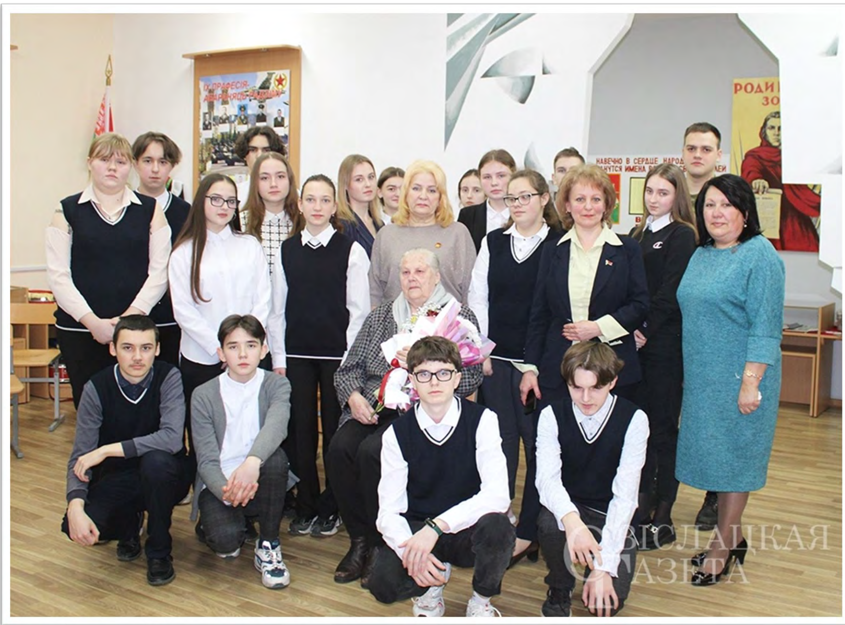
Круглый стол «О доблести, о мужестве, о чести»