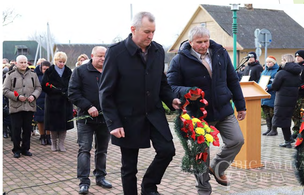
Митинг, посвященный памяти воинов-интернационалистов