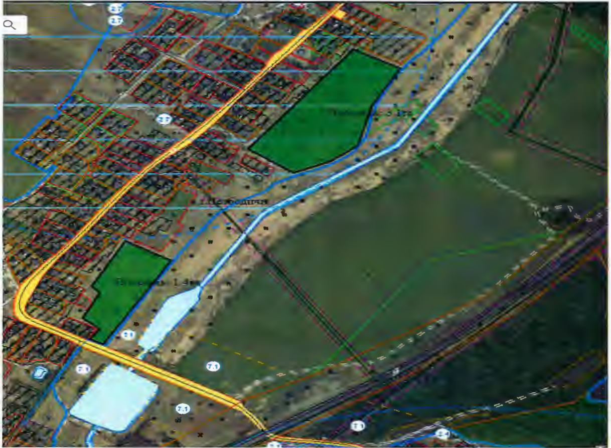
Д.Стоки – 15га