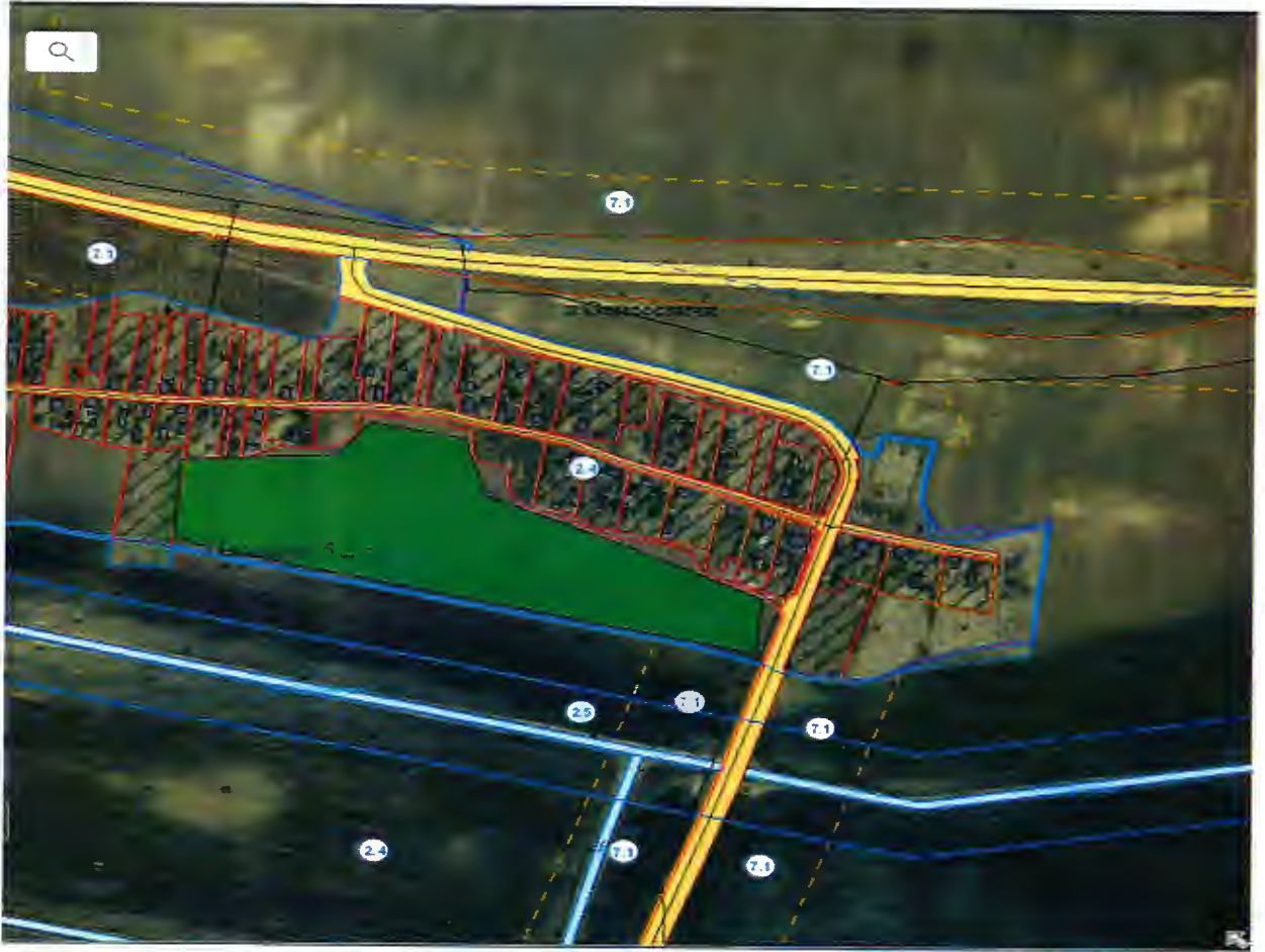
Д.Миничи – 2,4га